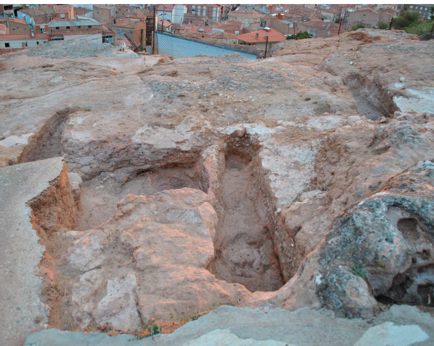
← Necrópolis del Cerro de San Miguel (Arnedo)

Si tienes alguna duda, por favor, ponte en contacto con eventosfundacion@unir.net