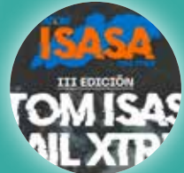
Atom Isasa Trail Xtrem