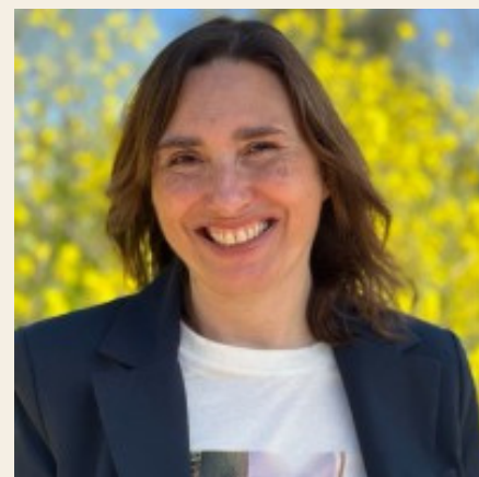
Mar Aísa Poderoso